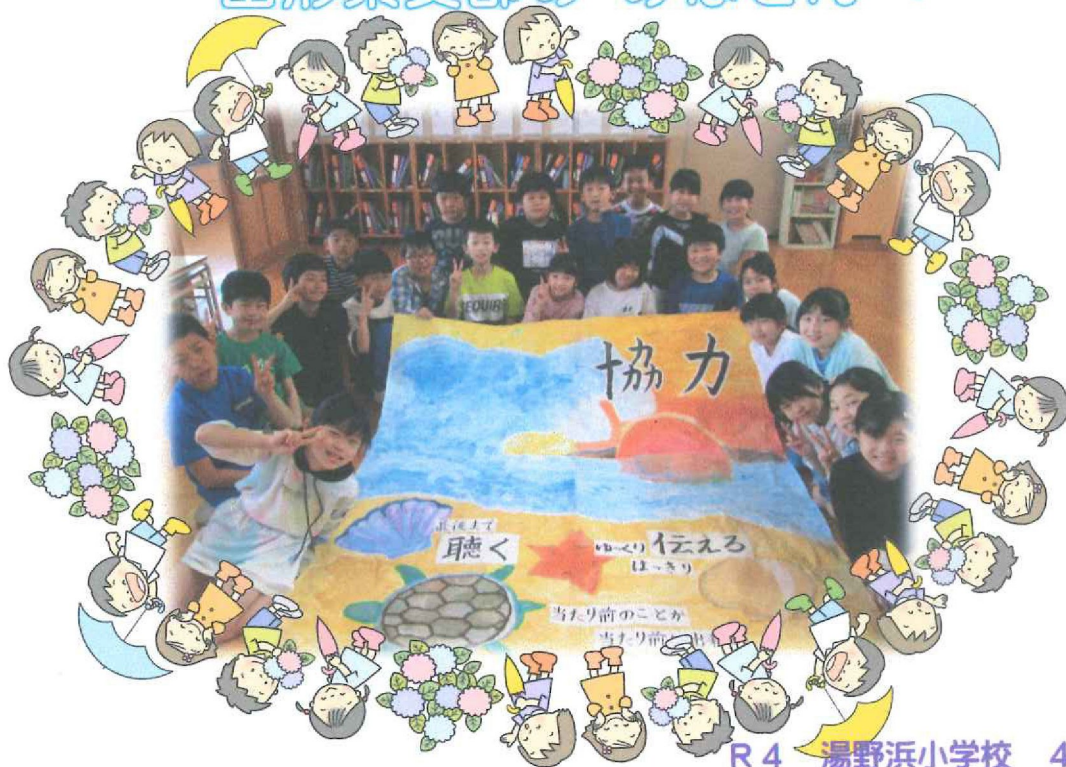
R4 湯野浜小学校 4年生より